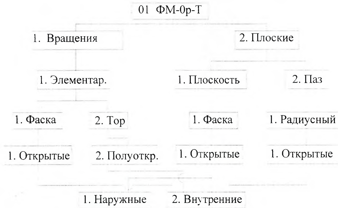
Рисунок А.1 – Схема классификации и кодирования функциональных модулей нулевого ранга – технологических