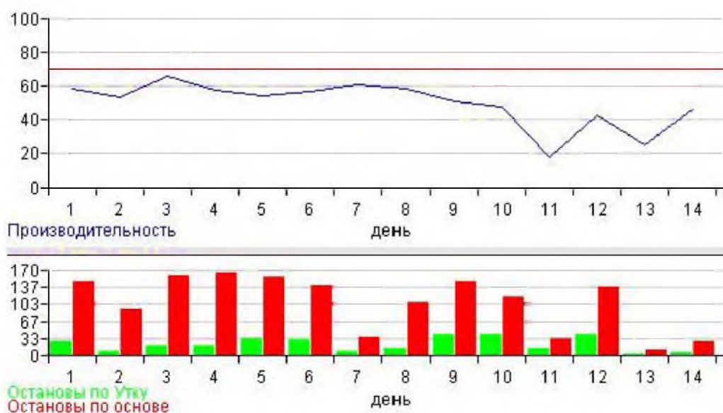
Рисунок 2 – График производительности ткацкого станка и гистограмма обрывности при использовании в шлихте препарата Инекс 773AS

3. При увеличении концентрации препарата Аркофил PPL в шлихте резко повышается обрывность на шлихтовальной машине, что фактически приводит к невозмож-