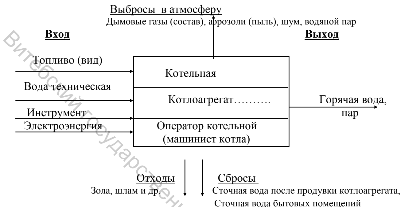
Рисунок П.1 – Схема материальных и энергетических потоков при работе котлоагрегата

Примеры составления схем материальных потоков