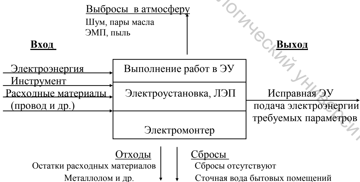
Рисунок П.2 – Схема материальных и энергетических потоков при работе электромонтера в электросетях