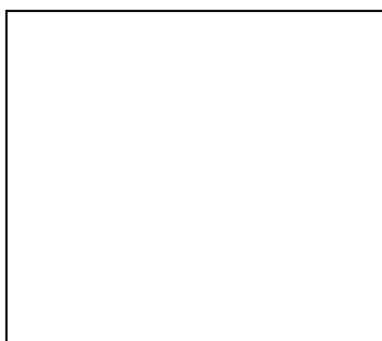
Рисунок 1 – «Магический квадрат» целей экономической политики

Представленные в графическом виде, эти цели образуют квадрат.